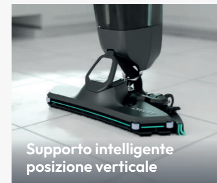
Supporto intelligente posizione verticale