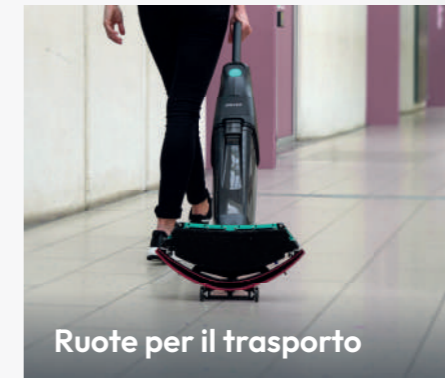
Ruote per il trasporto