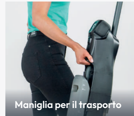
Maniglia per il trasporto