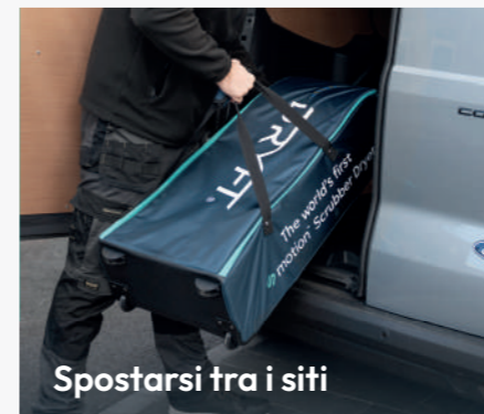
Spostarsi tra i siti