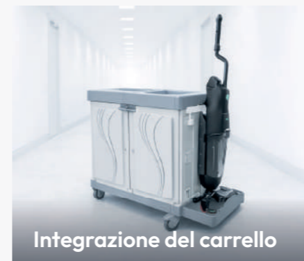
Integrazione del carrello